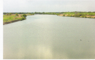
荒川の秋ヶ瀬取水堰から上流を望む