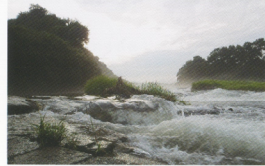
増水した都幾川の鞍掛堰