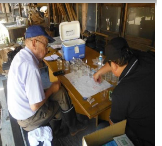
比企の川づくり協議会の皆さんによる水質検査の実施状況(6/1)